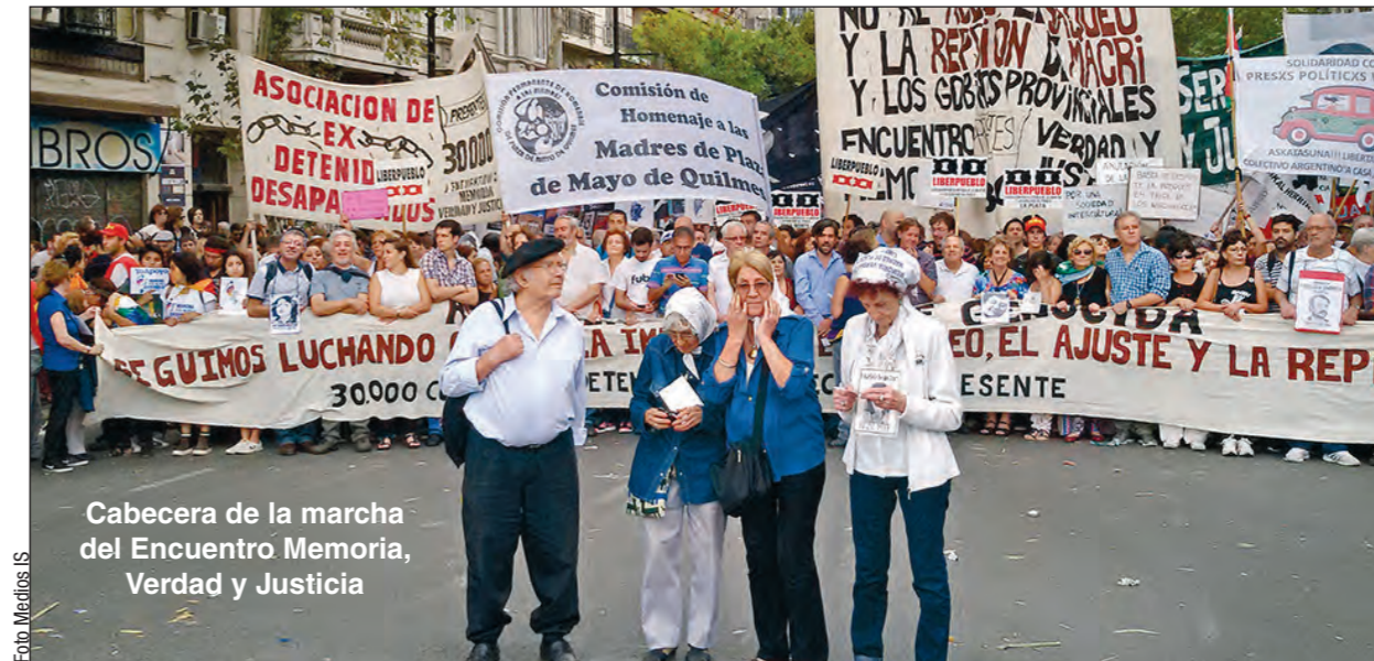
Cabecera de la marcha del Encuentro Memoria, Verdad y Justicia

Queremos agradecer a todos los compañeros que se sumaron a las columnas de Izquierda Socialista en el Frente de Izquierda y nos acompañaron para homenajear a nuestros compañeros asesinados y desaparecidos del glorioso PST, nuestro partido antecesor, en lucha por una Argentina y un mundo socialista. Los convocamos ahora a que se sumen a nuestro partido, para fortalecer las luchas en curso y los cambios de fondo que siguen pendientes.