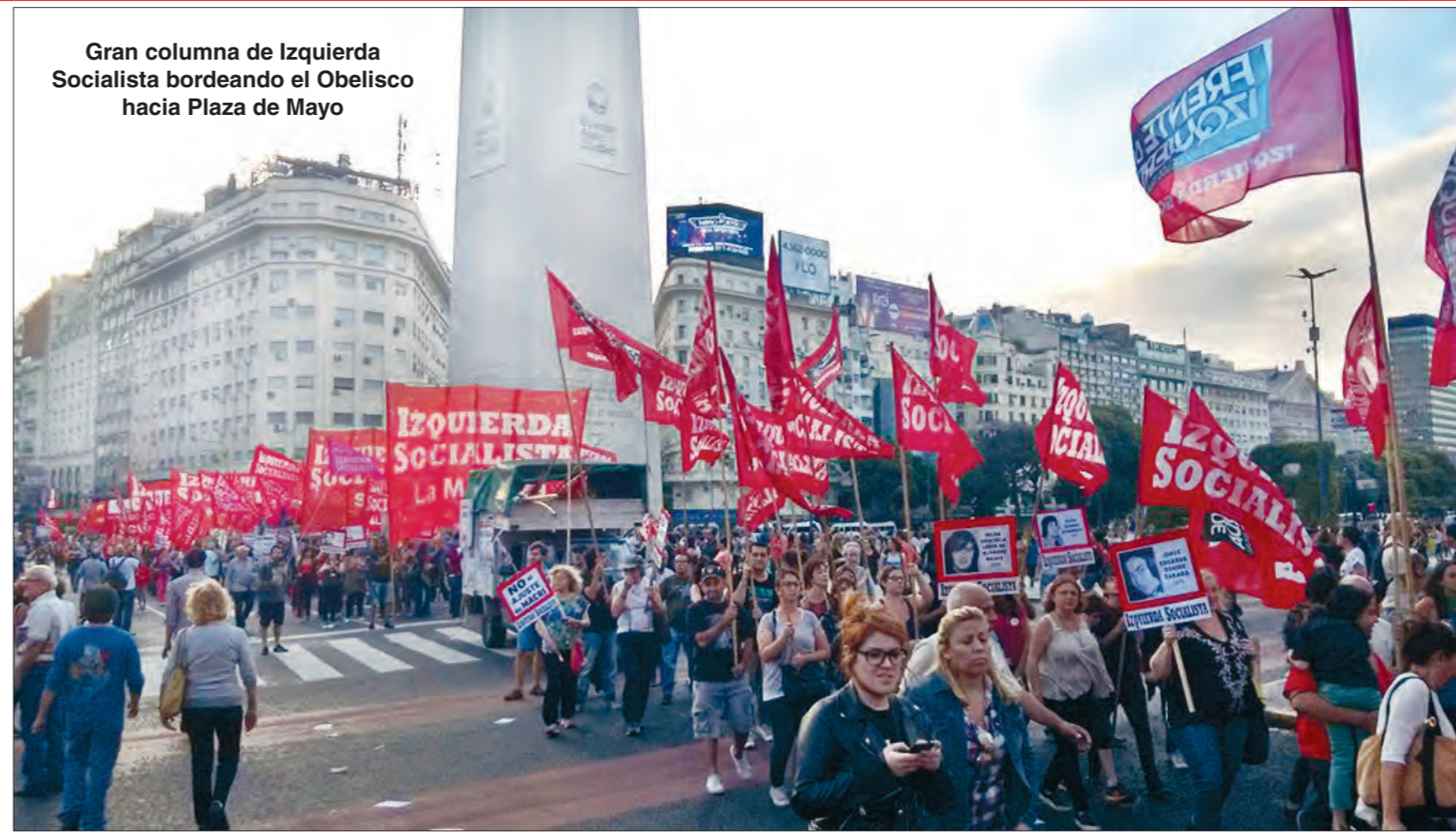
Gran columna de Izquierda Socialista bordeando el Obelisco hacia Plaza de Mayo

a que se terminen los juicios a los genocidas. Rápidamente hubo una asamblea de sus trabajadores en repudio. Eso mostró, a días de asumir el nuevo gobierno, que no había un giro del conjunto del electorado hacia posturas reaccionarias, ni ningún cheque en blanco a Cambiemos.