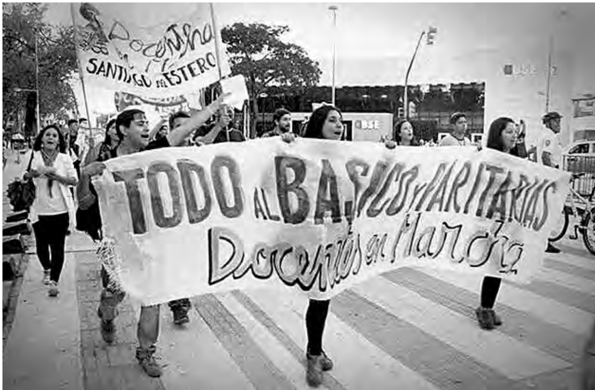
Docentes santiagueños movilizados

Hasta intentaron hacer una contramarcha con gente paga, pero nada de esto pudo frenar la oleada docente ni acallar nuestros reclamos y continuar con el plan de lucha que incluye participar de la marcha federal convocada por CEA (Confederación de Educadores Argentinos), nueva mar-