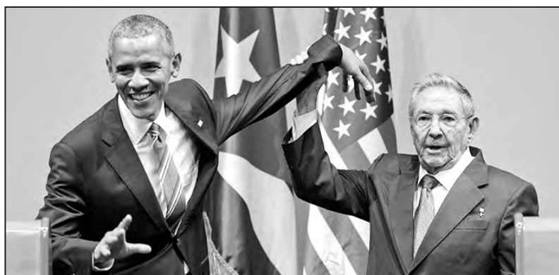
El presidente yanqui con Raúl Castro

Ante esto somos claros: los capitales extranjeros, en oposición a lo que pregonan Obama y Raúl Castro, no traerán ningún progreso al pueblo