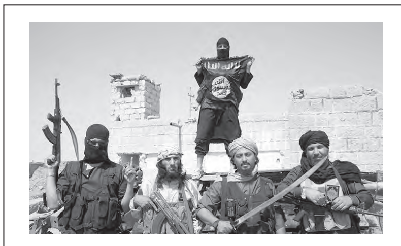
Miembros de ISIS

Desde la UIT-CI repudiamos una vez más estos nuevos atentados terroristas que ayudan objetivamente al imperialismo para seguir aplicando su política de represión y bombardeos en Siria, Irak, Yemen y Afganistán. Confiando en que solo la lucha de los pueblos del mundo podrá terminar con las agresiones imperialistas y sus bombardeos, con las dictaduras genocidas como la de Bashar Al Assad y con los grupos reaccionarios como el ISIS.