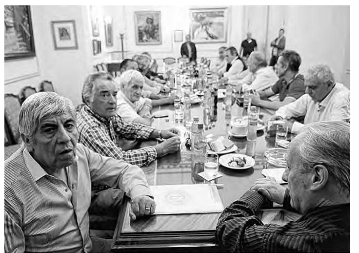
Su "lucha" se resume en ver a los diputados

Emitieron un documento en el que reconocen que "las medidas hasta aquí adoptadas (por Macri) siguen atentando contra el poder adquisitivo" y que "la promesa de campaña de que 'el trabajo no es ganancia' del presidente Macri