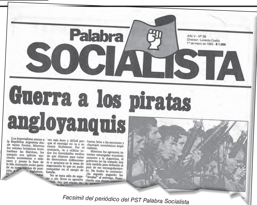
Facsimil del periódico del PST Palabra Socialista

Al mismo tiempo, radicales, peronistas, la iglesia católica y todas las fuerzas patronales fueron imponiendo la "desmalvinización". La inauguró el radical Alfonsín desde diciembre de 1983, quien calificó aquella guerra justa de "carro atmosférico". El peronista Menem siguió con sus relaciones carnales con los yanquis y un canciller que mandó ositos de peluche a los británicos en las islas. El kirchnerismo la mantuvo más allá de su típico doble discurso y las frases de rigor en las Naciones Unidas. Seguramente el nuevo gobierno de Macri tendrá su propia versión de la desmalvinización. Sigue y seguirá en manos de los trabajadores y el pueblo la gran tarea pendiente de recuperar nuestras islas.