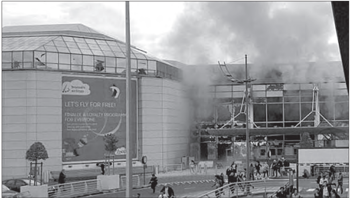
Aeropuerto de Bruselas al momento de la explosión

la llamada Coalición Internacional contra el terrorismo que encabeza Estados Unidos e integra Bélgica, que actúan bombardeando territorio sirio e irakí. De la misma manera que lo hacen Rusia e Irán.